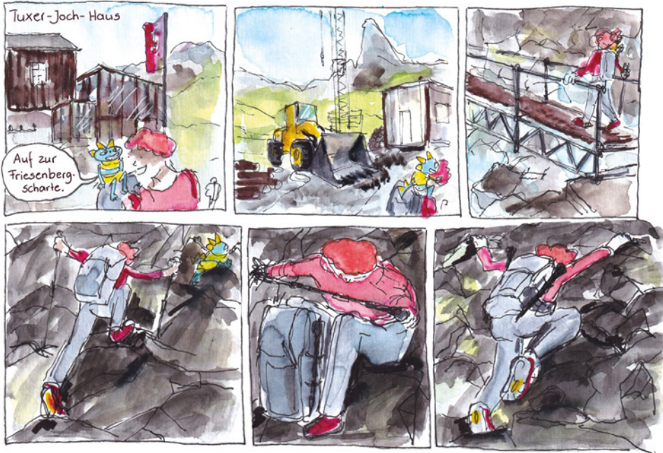
Beispielseiten aus dem Buch „Pilgern in Bildern Eine Comiczeichnerin auf Abwegen“