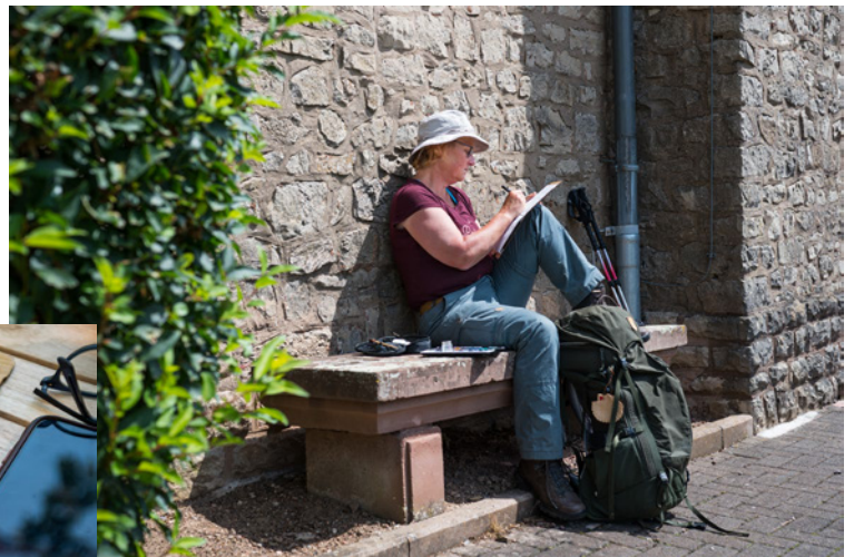
Zeichnen, wo immer sich die Gelegenheit bietet