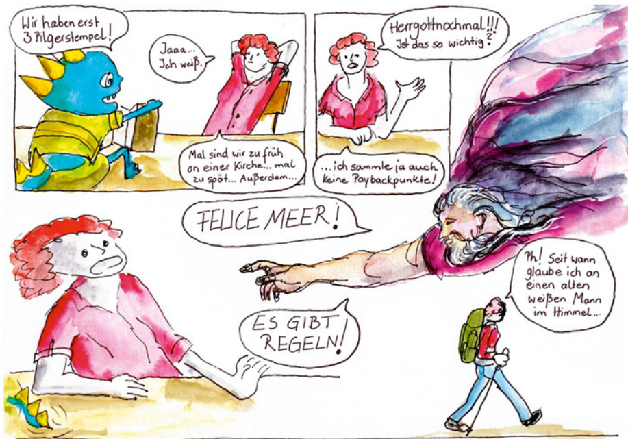
Beispielseiten aus dem Buch „Pilgern in Bildern Eine Comiczeichnerin auf Abwegen“