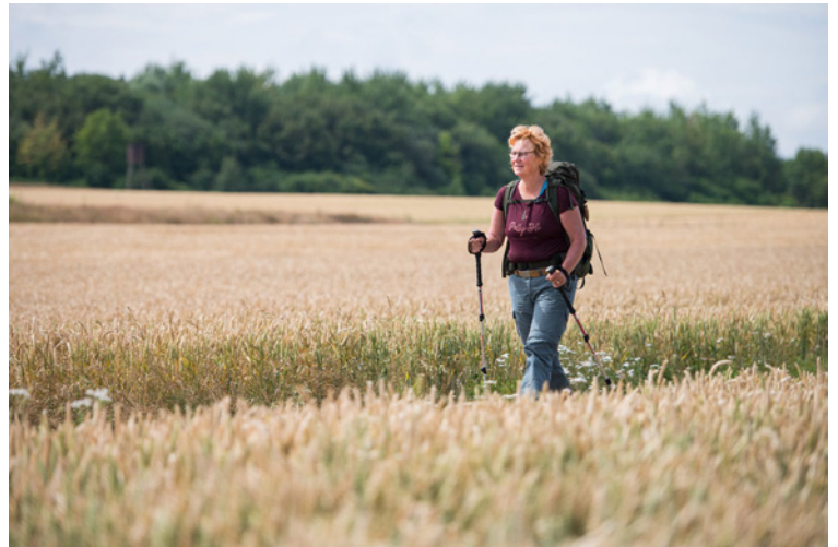
Unterwegs durch Deutschland